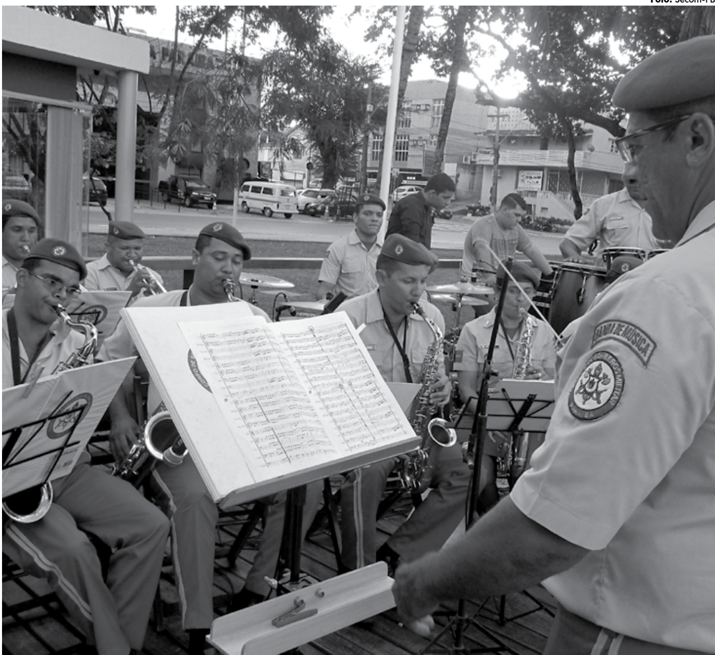
Ciclo de concertos da Banda de Música do Corpo de Bombeiros faz parte de um projeto que objetiva levar entretenimento à população

A apresentação já passou pelo Ponto de Cem Réis e pela Lagoa do Parque Solon de Lucena, no Centro de João Pessoa, e pela Praça Getúlio Vargas, no centro do município de Santa Rita.