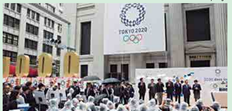
Os japoneses preparam um sistema de alta tecnologia para garantir a segurança das Olimpíadas

Os Jogos Olímpicos de Tóquio vão ocorrer entre os dias 24 de julho e 9 de agosto, enquanto os Jogos Paralímpicos estão programados para acontecer entre os dias 25 de agosto e 6 de setembro.