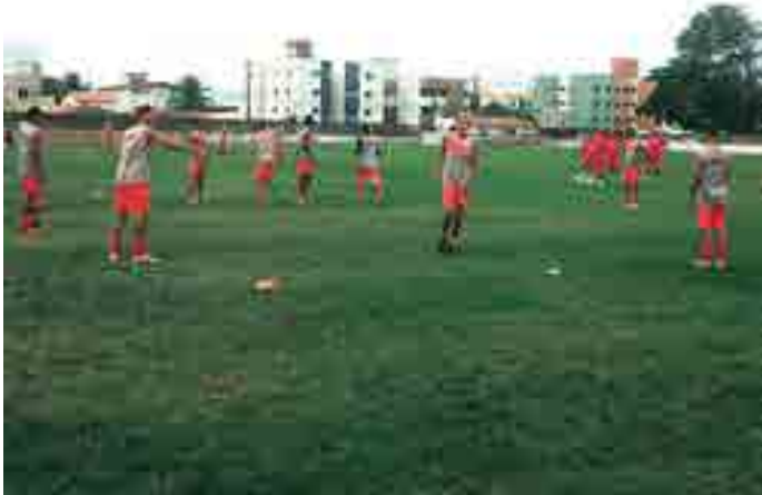
Jogadores do time Alvirrubro participando de treinos no Mangabeirão