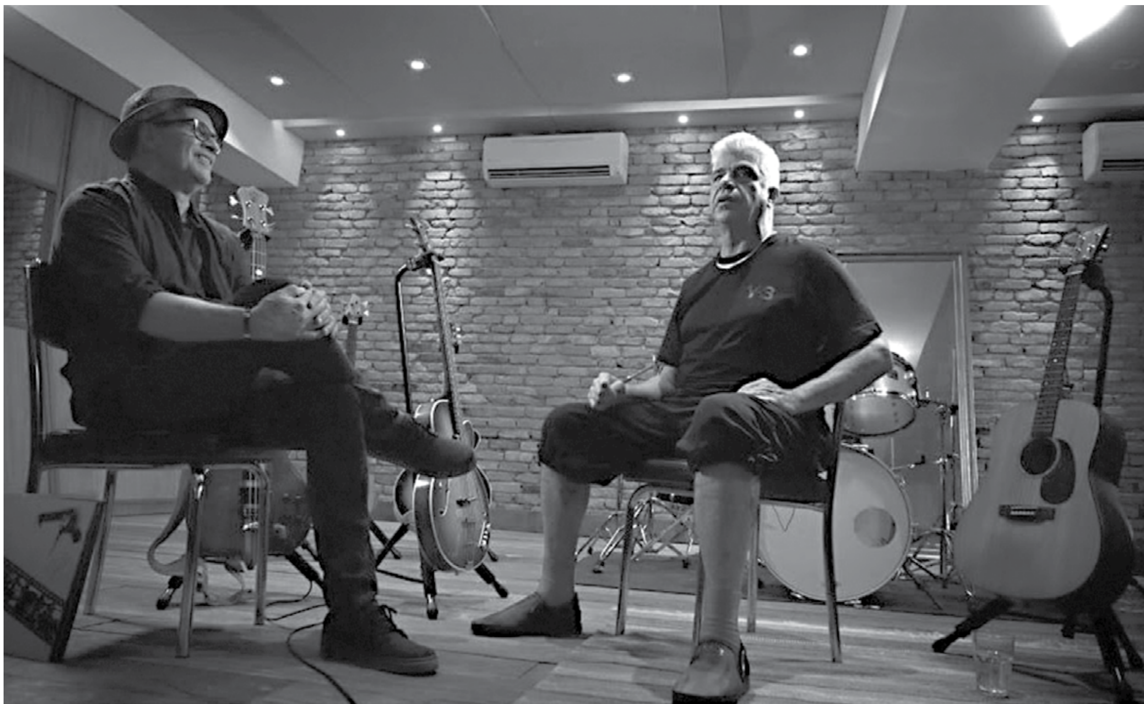
O convidado do primeiro episódio da série é o cantor e guitarrista Lulu Santos, que em conversa com Liminha vai relembrar histórias de bastidores e o processo de gravação no estúdio que funcionou na década de 1980