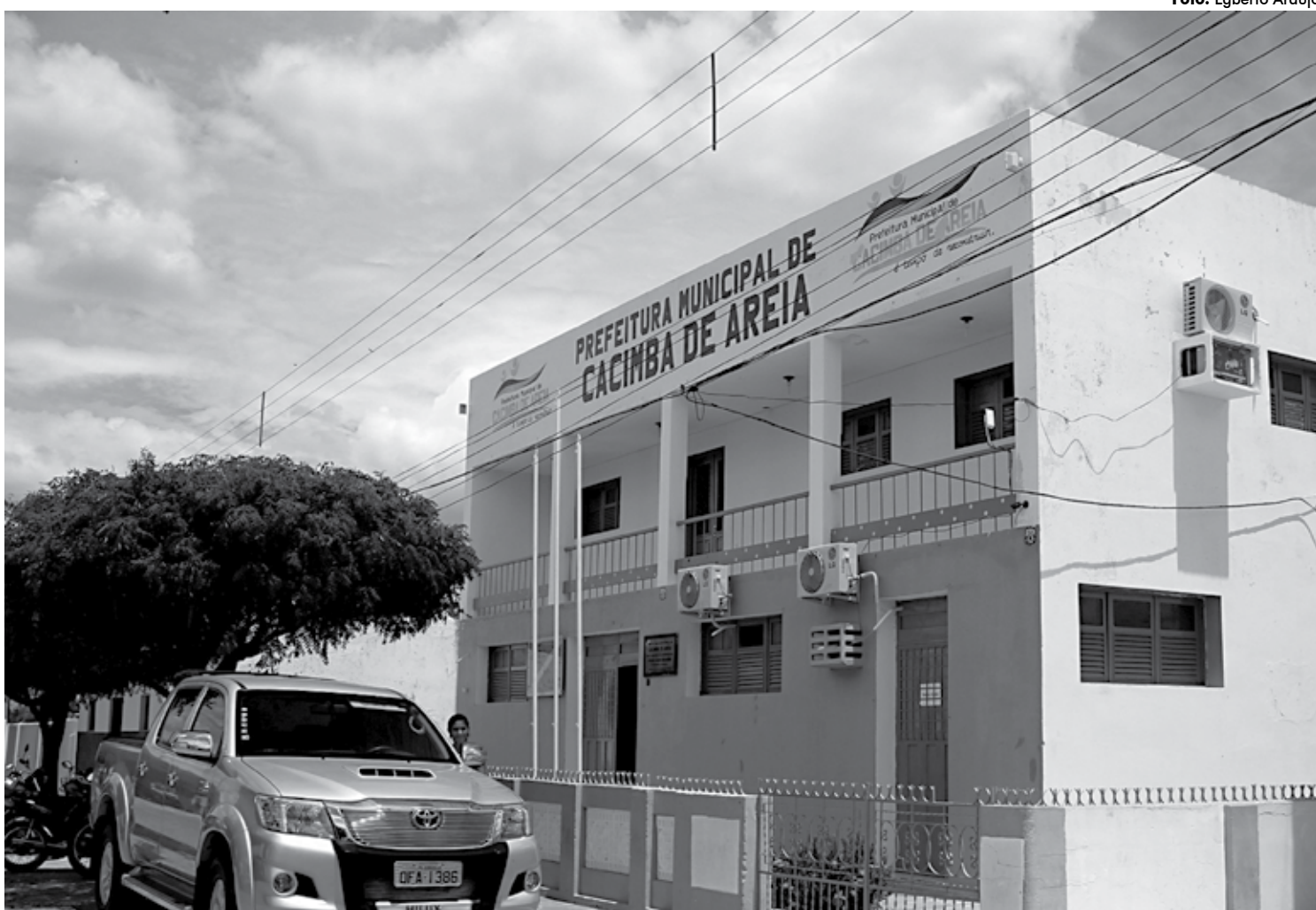
Cacimba de Areia é um município da microrregião de Patos, com uma área territorial de 233 km² e de acordo com o IBGE sua população é estimada em 3.557 habitantes