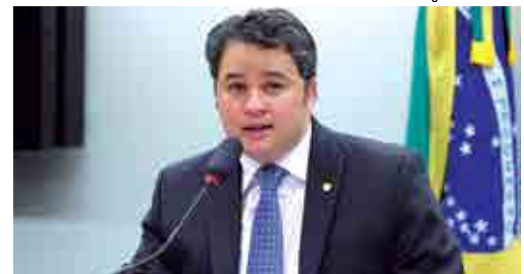
Para Efraim Filho, população precisa participar dos debates e entender

O coordenador de Previdência Social do IPEA, Rogério Nagamine, explica que esse tipo de despesa atrasa os investimentos do Estado em outros setores importantes. "Os vários problemas relacionados a esse nível de despesa e déficit incluem