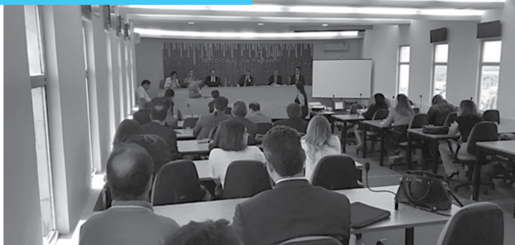
Medidas foram aprovadas pelo Conselho Estadual da Ordem na última sessão deliberativa do ano