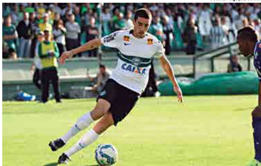
Meia foi um dos destaques quando atuava no Coritiba e hoje deve assinar contrato com o time vascaíno

Além deles, os vascaínos seguem buscando um acerto com Vitória para a contratação do atacante Kieza. Foi cogitado uma troca pelo meia Escudero, mas até o momento nada foi definido.