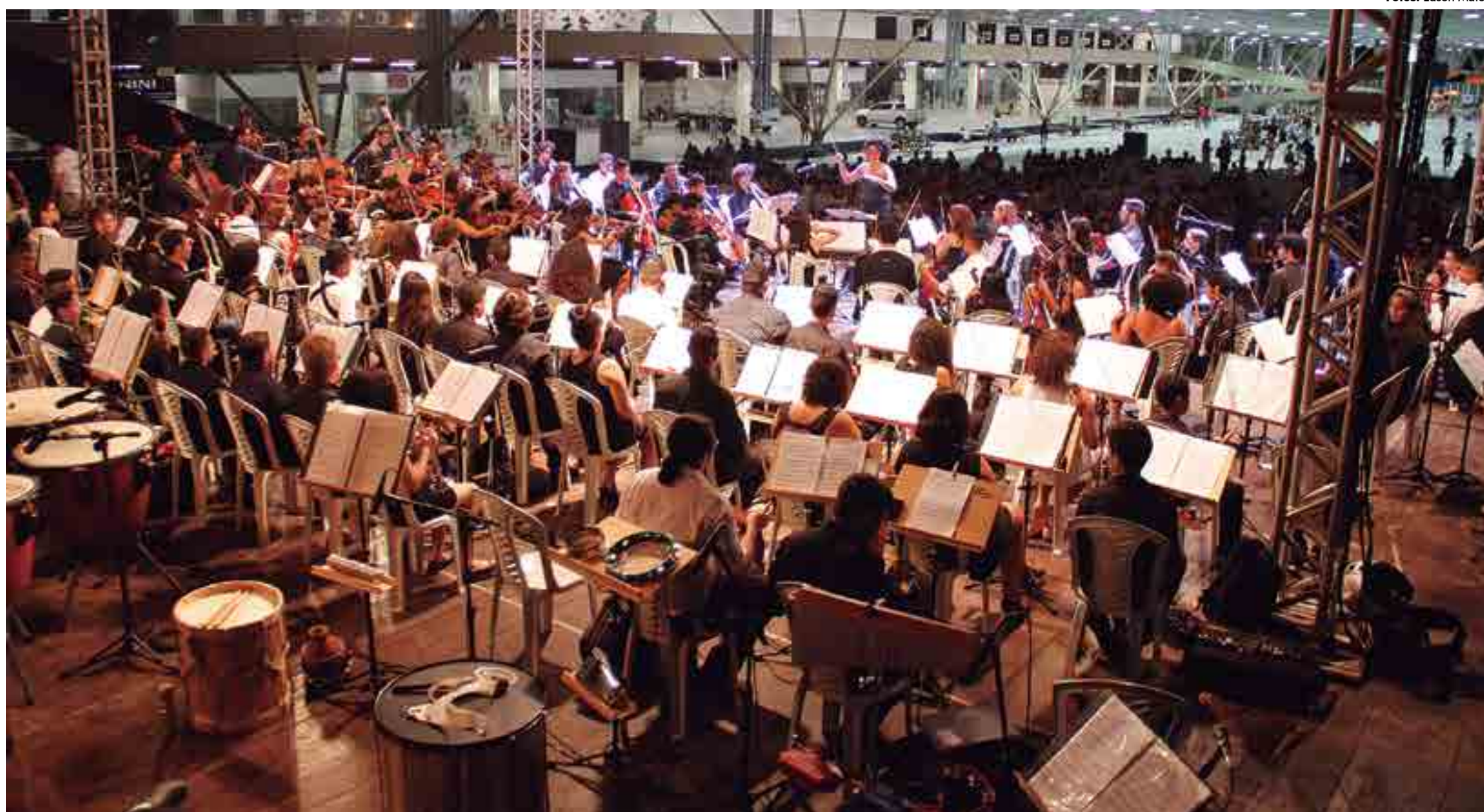
Criado em 2012 pelo Governo do Estado da Paraíba, o Programa de Inclusão através da Música e das Artes (Prima) vêm mudando a realidade de crianças e jovens moradores de comunidades e áreas de vulnerabilidade social