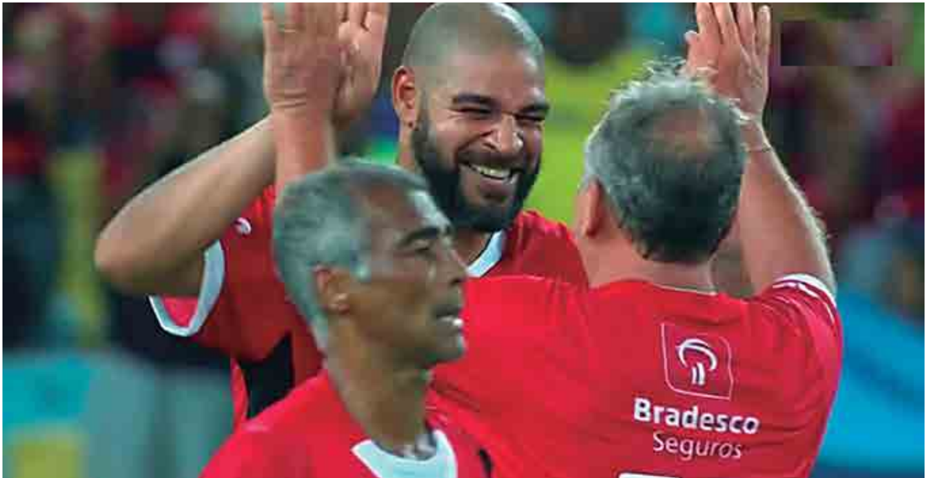
Adriano marcou um dos gols, deu assistência e foi uma das estrelas, ao lado de Romário, da festa promovida por Zico no Maracanã, que reuniu mais de 45 mil pessoas na última quarta-feira